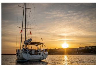
OCEANIS 46.1 - layout 4 CABINS & 2 HEADS